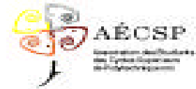
Association des étudiants des cycles supérieurs de Polytechnique